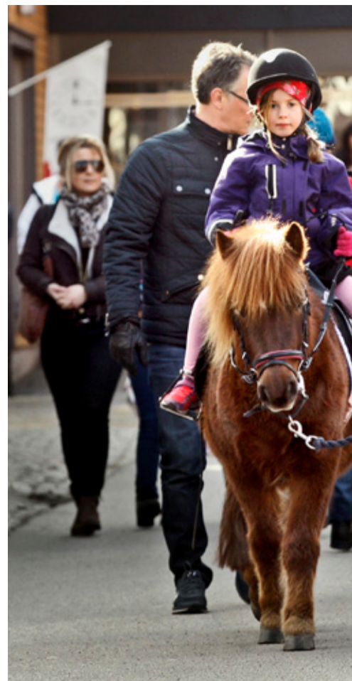
Ponnyridningen var mycket populär. Här är